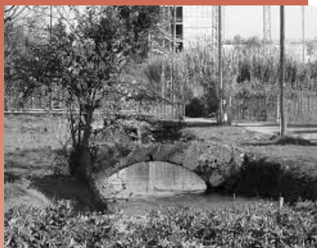
Pont de la Corredora Mestre, abans de la seva desaparició