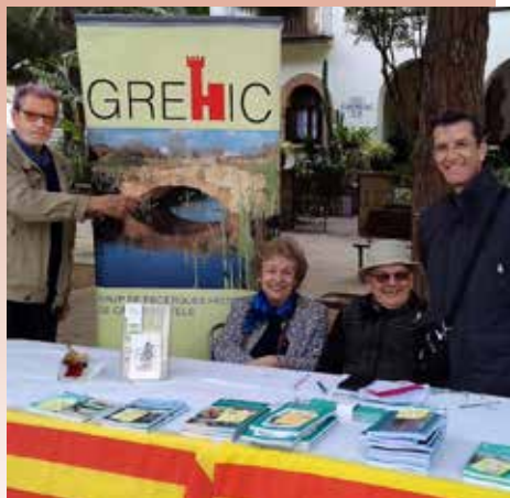
El GREHIC, a la fira de Sant Jordi, reivindicant la restauració i restitució del nostre "Pontet".