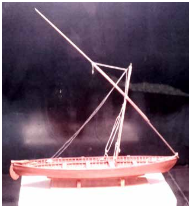
La maqueta de la nau Sorres X que presenta el Museu Marítim és obra de Josep Maria i Antoni Casals, i va ser feta a escala 1:20.

El més probable es que fos peix capturat al golf de Cadis, trossejat i salat, destinat als grans centres de consum, com ara la ciutat de Barcelona.