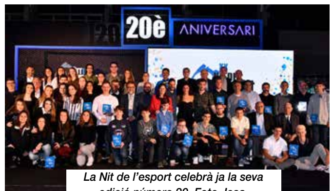
La Nit de l'esport celebrà ja la seva edició número 20.